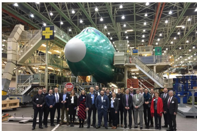
Besuch bei Boeing im Zuge der Geschäftsanbahnungsreise 2019

Die Süderelbe AG betreut seit mehr als 10 Jahren Netzwerk- und Clusterprojekte in der Luft- und Raumfahrtbranche. Über die Partnerschaft innerhalb der Supply Chain Excellence Initiative sind alle deutschen Luftfahrtcluster und -verbände in das Projekt eingebunden.